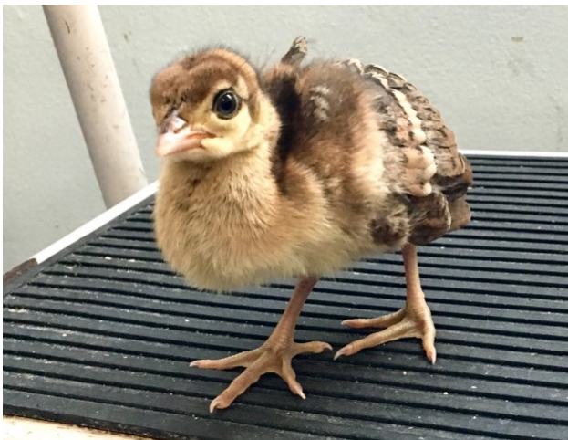
[Left] Peafowl chick

Ámbito: tienden a desplazarse libremente en la primavera y el verano hasta encontrar un ámbito adecuado. Luego, pueden permanecer como residentes en esta área. Los machos defienden el territorio durante la temporada de reproducción. Los machos solitarios se desplazan libremente durante todo el año.